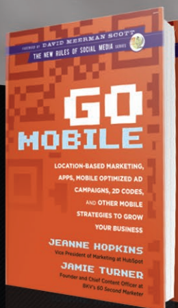
GO MOBILE (2012)