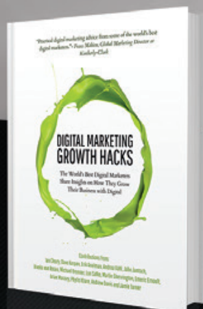
DIGITAL MARKETING GROWTH HACKS (2017)