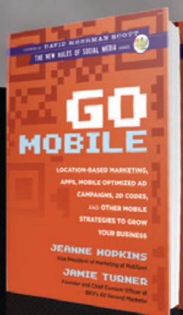
GO MOBILE (2012)