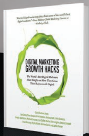
DIGITAL MARKETING GROWTH HACKS (2017)