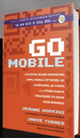
GO MOBILE (2012)