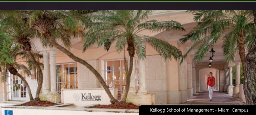
Kellogg School of Management - Miami Campus