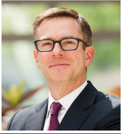
Randall S. Kroszner Norman R. Bobins Professor of Economics, Chicago Booth