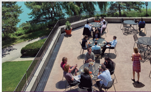
The James L. Allen Center